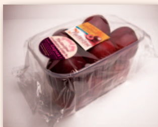
Barquette 2 kgs