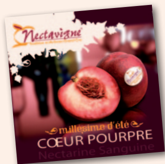
Mobile ø 40 cm