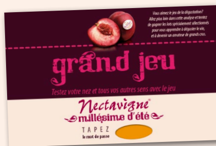
Page d'accueil Jeu Web

Support : sticker sur fruits et barquettes et ronds de plateau.